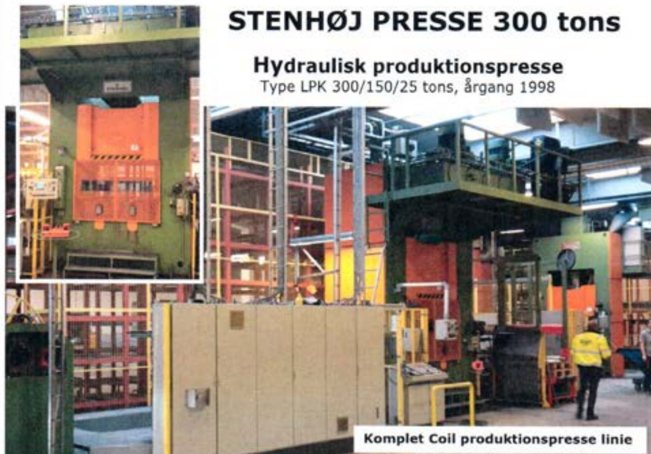
Komplet Coil produktionspresse linie

Coil afvikler SMV Industrier - Type PLAH-6000 Med tilførselsbord - Type PLLB-6000 Inkl. styring